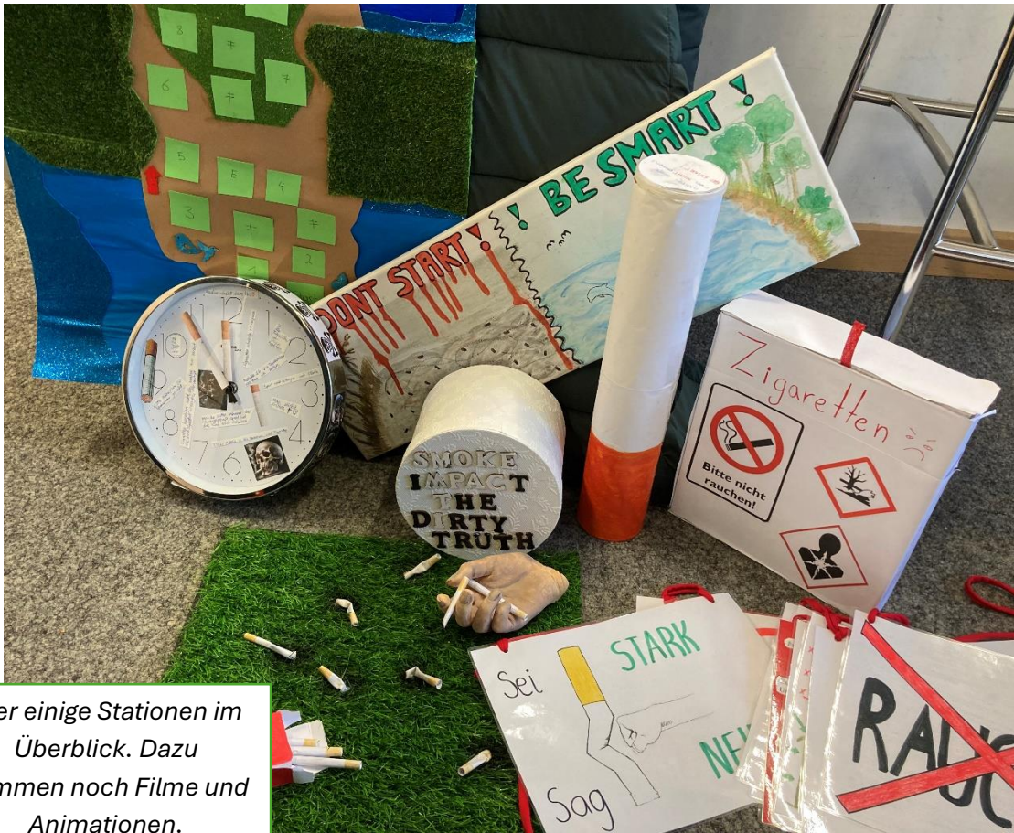
Hier einige Stationen im Überblick. Dazu kommen noch Filme und Animationen.

Wir stellen euch nun noch alle Stationen des Projekttagess kurz vor: